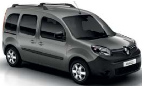
Gris Topo (O)