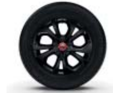
Llantas de aleación ARIA de 38 cm (15")