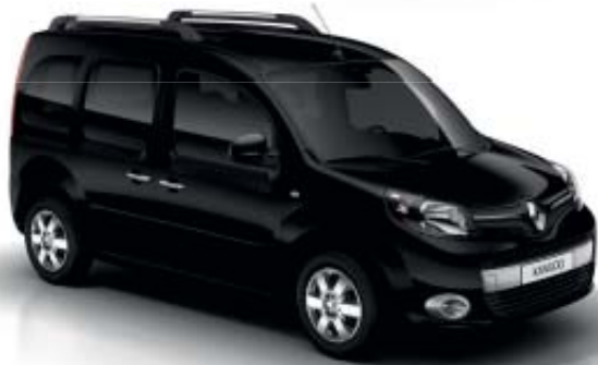
Negro Metalizado (M)