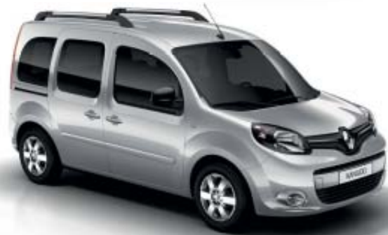
Gris Platino (M)