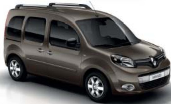
Marrón Moka (M)