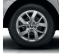
Llantas de aleación CELSIUM de 38 cm (15")