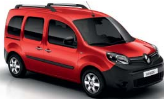
Rojo Vivo (O)