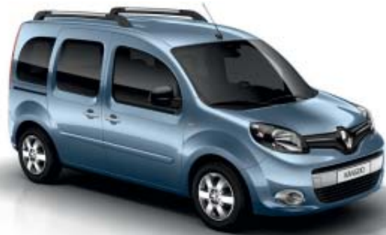
Azul Estrella (M)