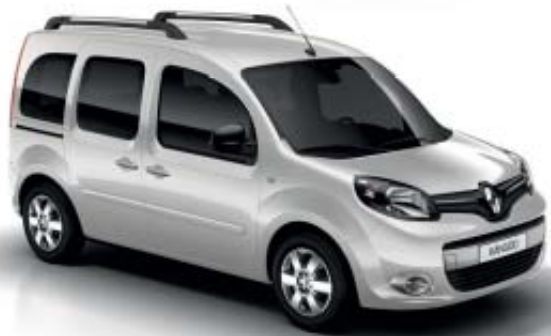
Blanco Mineral (O)