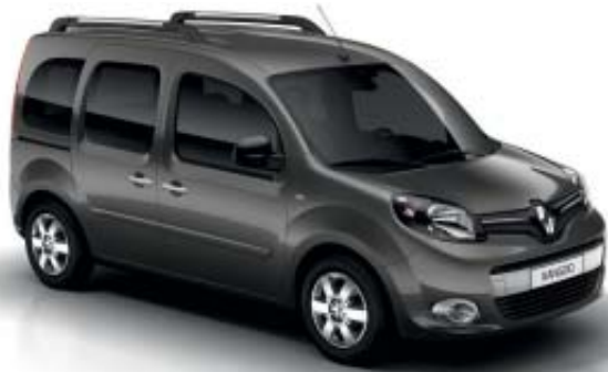
Gris Casiopea (M)