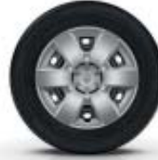
Llantas de aleación ARIA de 38 cm (15")