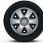
Embellecedor Brigantin de 38 cm (15")