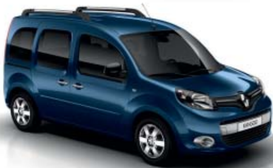
Azul Cosmos (O)

O: Pintura opaca M: Pintura metalizada Color Rojo Vivo y Gris Topo no disponible en versiones con paragolpes color carrocería. Las fotos no son contractuales.